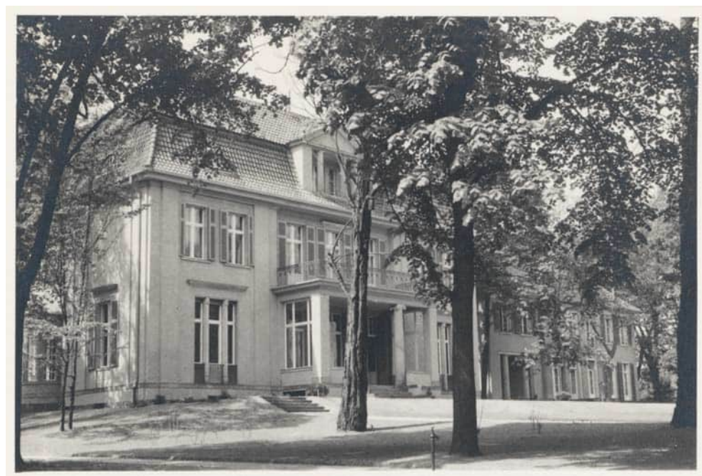
Postkarte aus dem Lager der Gefolgschaft der Deutschen Reichspost mit Ansicht der Villen Hamspohn und Liebermann

Ich bin 84 Jahre alt und habe bis vor einigen Monaten niemals an eine Auswanderung gedacht. Aber hier ist jetzt die Situation unerträglich geworden und ebenso wie die heutigen Verhältnisse unvorstellbar waren, ebenso ist nicht möglich zu ahnen, was noch passieren kann. Ich danke jeden