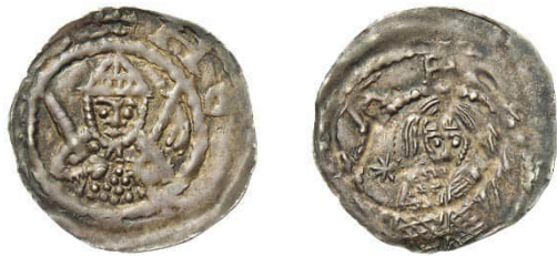
Abb. 11: Staatliche Museen zu Berlin, Münzkabinett, Objektnummer 18216623, Bode-Museum, nicht ausgestellt, 0,65 g, 20 mm (Vergrößerung 1,5:1). 36 Vorderseite: Die Umschrift lautet + HE[IN BRAND] (= Heinrich, Brandenburg).

Aufgrund anderer Exemplare, auf denen die Schrift besser erhalten ist, lässt sich der Text leicht