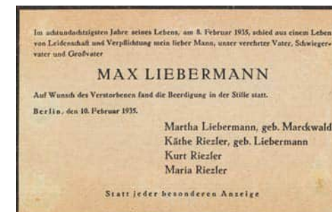
Todesanzeige Max Liebermann, 1935

Aber es war nicht nur der Reichspropagandaminister, der in die Sommerfrische nach Wannsee zog. Auch die Deutsche Reichspost nahm den 6. Juni 1941 zum Anlass, das wunderbare Naturgeschehen zu nutzen, um die von der Jüdin Martha Liebermann unter Zwang »erworbene« und zu diesem Zweck hergerichtete Villa der Familie Liebermann mit der Eröffnung des »1. Lagerlehrgangs für die weibliche Gefolgschaft der Reichspost in Wannsee« einzuweihen. Dies stellte den »krönenden« Abschluss der im Jahre 1940 gefassten Pläne von Reichspostminister Wilhelm Ohnesorge und seinen Beamten dar, hier an dieser prominenten Stelle eine solche Einrichtung zu schaffen. Möglich war dies nur aufgrund der systematischen Entrechtung und Verfolgung der jüdischen Bevölkerung. Der berühmte Maler und Präsident der Berliner Akademie der Künste Max Liebermann war am 8. Februar 1935 verstorben. Seine Beerdigung wurde nur von seiner Familie und wenigen Getreuen begleitet. Das Land Berlin und die Nationalsozialisten taten alles, um die Bestattung ihres Ehrenbürgers so geräuschlos wie möglich, abgeschirmt von der Geheimen Staatspolizei, stattfinden zu lassen. 4