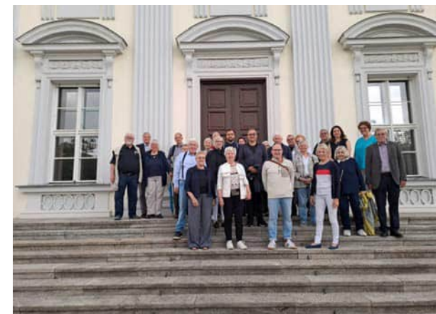
Gruppenfoto vor dem Schloss Bellevue am 28. Juli 2025.