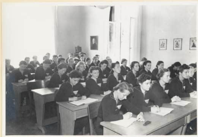
Die Teilnehmerinnen im Lehrsaal während eines Vortrags