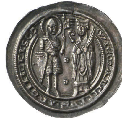
Abb. 9: Staatliche Museen zu Berlin, Münzkabinett, Objektnummer 18201096, Bode-Museum, Raum 242, Vitrine 51, Nr. 34, 0,93 g, 36 mm (Vergrößerung 1,5:1). 34 Die Umschrift lautet WICMANNIVS ARCHIEPISCO [ Wicmannus Archiepiscopus ] (= Erzbischof Wichmann). Auf der linken Seite sieht man den Heiligen Mauritius mit Heiligenschein in Rüstung. In der Rechten hält er einen Schild, in der Linken eine Fahne. Auf der rechten Seite steht Wichmann mit Mitra. In der Rechten hält er den Krummstab (Bischofsstab), in der Linken einen Palmzweig.