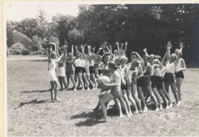
Die Teilnehmerinnen des Lagers bei Sport und Spiel