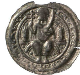
Abb. 5: Staatliche Museen zu Berlin, Münzkabinett, Objekt Nummer 18205005, Bode-Museum, Raum 242, Vitrine 51, Nr. 23, 0,70 g, 27 mm (Vergrößerung 1,5:1). 13 Die Umschrift lautet IACZO DE COPNIC DENARII (= Denare/ Pfennige des Jacza von Köpenick). Der frontal dargestellte, bärtige Jacza sitzt auf einer Balustrade mit seitlichen Türmen. In der Rechten hält er ein Doppelkreuz und in der Linken einen Palmzweig.