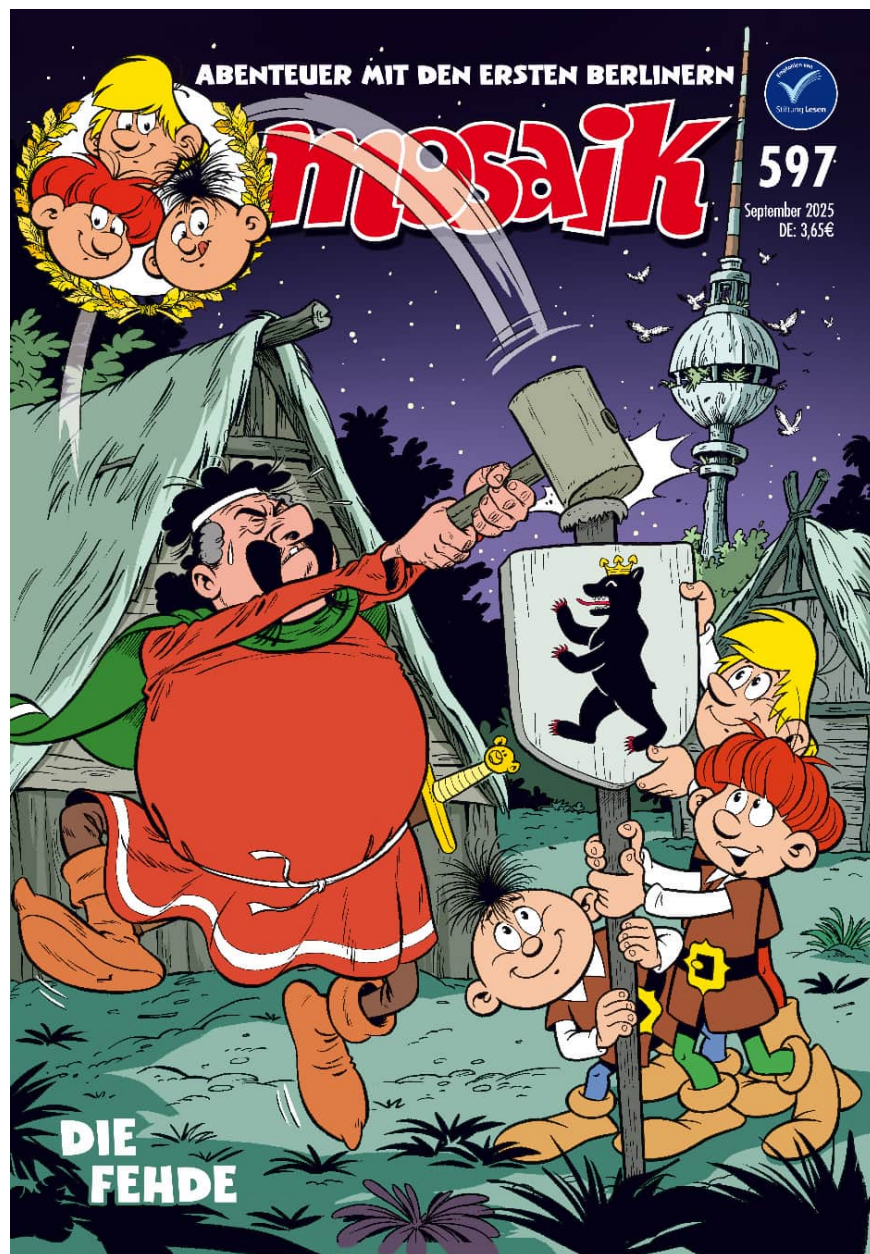
© MOSAIK – Die Abrafaxe 2026

Die Septemberausgabe 2025 (Heft 597) mit dem Titel »Die Fehde« sorgte für einiges Aufsehen in Berlin. Denn die drei Abrafaxe nehmen an der Gründung Berlins teil und verhindern die Zerstörung Cöllns und Berlins durch Markgraf Albrecht den Bären und Jacza von Köpenick (Copnec). Glaubt man dem Comic, verdanken wir das gesamte weitere Schicksal der Doppelstadt und des heutigen »Bärin« einem kleinen Missverständnis Albrechts des Bären, der dachte, die Stadt sei nach ihm benannt, und Brabax' geschicktem (Nicht-)Eingreifen.