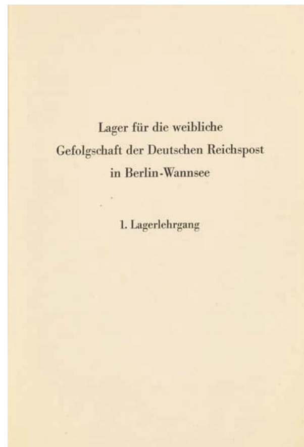
Fotobroschüre 1. Lagerlehrgang

Der am 15. Februar 1890 geborene studierte Chemiker Dr. Robert Ley gehörte zu den 24 im Nürnberger Prozess gegen die Hauptkriegsverbrecher vor dem Internationalen Militärgerichtshof Angeklagten und beging kurz vor Prozessbeginn Suizid. Er war seit 1923 begeistertes Parteimitglied und durchlief eine steile Karriere im Nationalsozialismus. Seine Vergötterung der Person Hitlers zeigte, wie das Führerprinzip sein Denken prägte. Im Mai 1942 bekannte er in einer Rede in Karlsruhe, dass es seiner Ansicht nach nicht reiche, den jüdischen Feind zu isolieren, man müsse die Juden ausrotten. 12 Ihm wurde eine starke Neigung zum Alkohol (er soll des Öfteren volltrunken Auto gefahren sein) nachgesagt, was im Volksmund dazu führte, ihn mit den Spitznamen