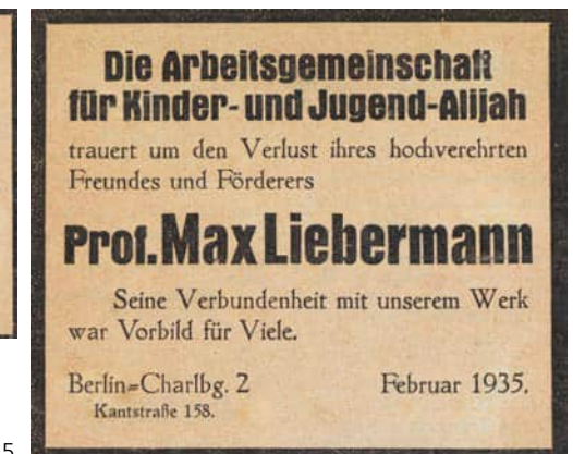
Traueranzeige Max Liebermann, 1935