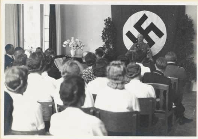
Reichsorganisationsleiter Dr. Ley während seiner Ansprache