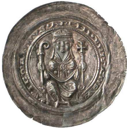
Abb. 7: Staatliche Museen zu Berlin, Münzkabinett, Objektnummer 18205008, Bode-Museum, Raum 242, Vitrine 51, Nr. 29, 0,86 g, 39 mm (Vergrößerung 1,5:1). 32 Die Umschrift lautet WICMANNVS ARCHIEPISCOPVS (= Erzbischof Wichmann). Der sitzende Erzbischof Wichmann mit Mitra hält in seiner Rechten einen Krummstab (Bischofsstab) und in der Linken einen Kreuzstab.

Abschließend soll mit Erzbischof Wichmann von Magdeburg noch ein geistlicher Münzherr in den Blick genommen werden. Seine Brakteaten arbeiten mit einer anderen Symbolik als Albrecht der Bär und Jacza von Köpenick. 31 Auch Wichmanns Münzen wären sicherlich im Geldbeutel der Abrafaxe gelandet. In der Dauerausstellung des Münzkabinetts sind acht Brakteaten Wichmanns ausgestellt, von denen hier die Hälfte präsentiert werden soll. Drei davon (Abb. 7, 9, 10) wurden nach Manfred Mehl, dem besten Kenner der Magdeburger Münzprägung in der Münzstätte Halle geprägt. Beim vierten Stück (Abb. 8) ist unklar, ob die Prägung in Halle oder Magdeburg selbst stattfand.