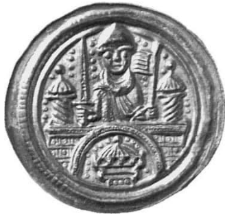
Abb. 2: Staatliche Museen zu Berlin, Münzkabinett, Objekt Nummer 18206407, Bode-Museum, Raum 242, Vitrine 52, Nr. 34, 0,88 g, 28 mm (Vergrößerung 1,5:1). 8 Der Brakteat, der dem Halberstädter Brakteatenmeister zugeschrieben wird, zeigt den gerüsteten Albrecht frontal hinter einer Tormauer mit zwei Türmen. In der Rechten hält er ein Schwert und in der Linken eine Fahne. Im Tordurchgang ist ein weiterer Turm zu sehen.

Nicht in der Dauerausstellung zu sehen sind Münzen Albrechts aus Brandenburg, das er erst 1157 endgültig in Besitz nehmen konnte. Beim Betrachten springt das deutlich geringere Geschick des Stempelschneiders von Abbildung 3 im Vergleich zum Halberstädter Meister gleich ins Auge.