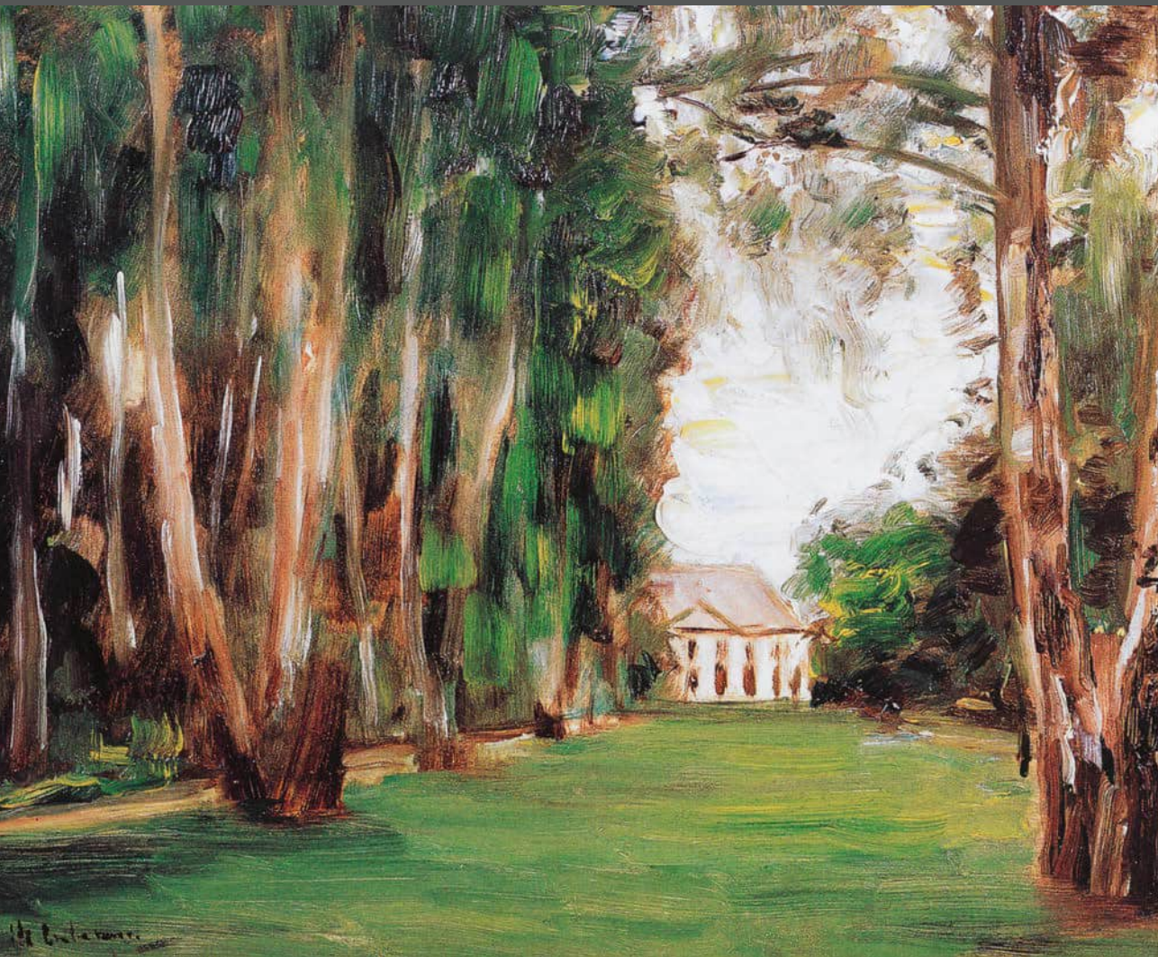
Max Liebermann: Die Birkenallee in Wannsee nach Westen, 1926

des Vereins für die Geschichte Berlins Gegründet 1865