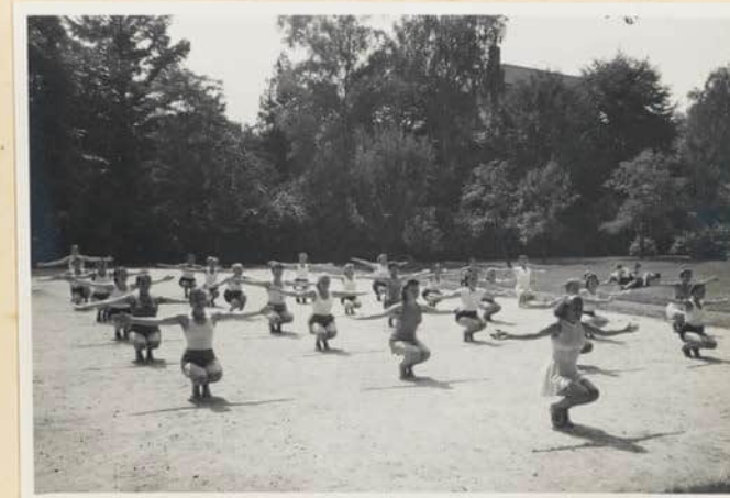
Die Teilnehmerinnen des Lagers bei Sport und Spiel