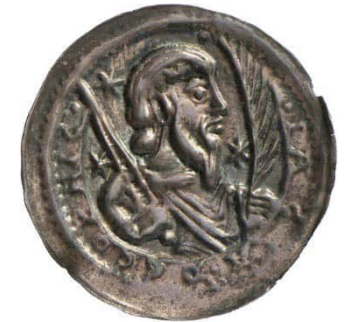
Abb. 4: Staatliche Museen zu Berlin, Münzkabinett, Objekt Nummer 18205004, Bode-Museum, Raum 242, Vitrine 51, Nr. 21, 0,87 g, 28 mm (Vergrößerung 1,5:1). 12 Die Umschrift lautet IACZA DE COPNIC (= Jacza von Köpenick). Der im Profil dargestellte, bärtige Jacza mit langem Haar hält in der Rechten ein Schwert und in der Linken einen Palmzweig.

In der Dauerausstellung des Münzkabinetts sind gleich drei Stücke Jaczas in Augenschein zu nehmen. Daneben besitzt das Münzkabinett weitere Exemplare, die nicht ausgestellt, aber zum großen Teil im Interaktiven Katalog erfasst sind. 11 Es ist nicht unwahrscheinlich, dass diese Münzen auch in Köpenick, dem Zentrum von Jaczas Herrschaftsgebiet, geprägt worden sind, auch wenn die Worte DE COPNIC auf den Münzen eigentlich keine Prägestätte bezeichnen, sondern sich auf die Person Jacza beziehungsweise sein Herrschaftsgebiet beziehen.