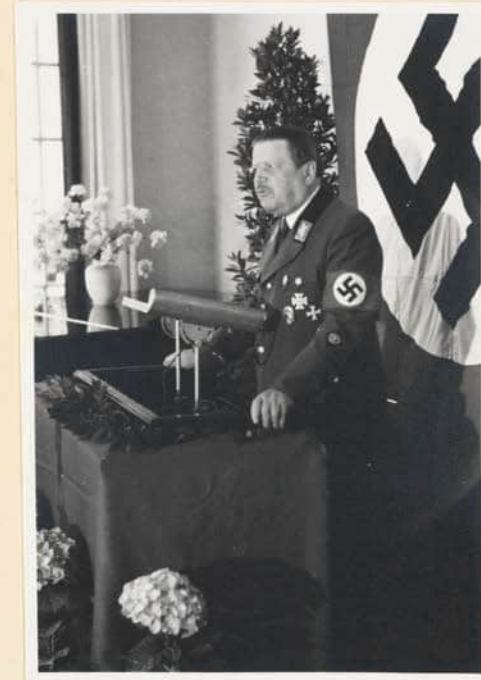
Reichspostminister Dr.-Ing. e. h. Ohnesorge spricht zum Lehrgang