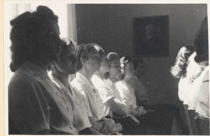
Während der Weiherede des Reichsorganisationsleiters Dr. Ley