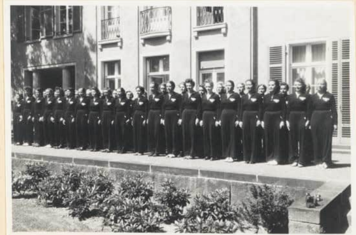
Angetreten zur morgendlichen Flaggenhissung »Stillgestanden!« lautet das Kommando