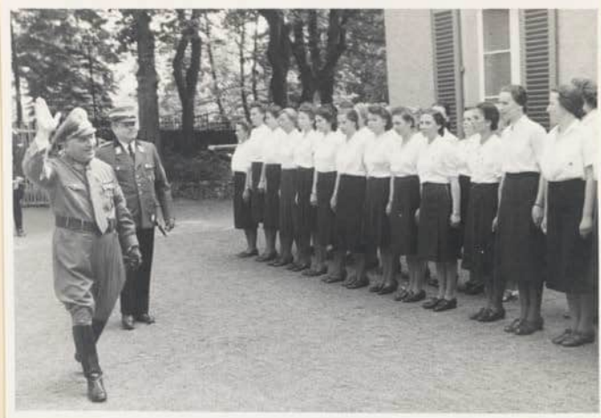
Reichsorganisationsleiter Dr. Ley begrüßt den Lehrgang