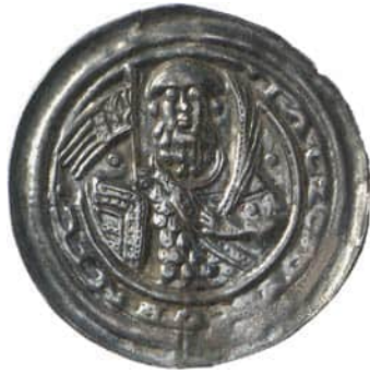
Abb. 6: Staatliche Museen zu Berlin, Münzkabinett, Objektnummer 18201100, Bode-Museum, Raum 242, Vitrine 51, Nr. 22, 0,82 g, 27 mm (Vergrößerung 1,5:1). 14 Die Umschrift lautet IACZO DE COPNIC (= Jacza von Köpenick). Der frontal dargestellte, bärtige Jacza trägt einen Panzer. In der Rechten hält er eine Fahne und einen Schild, in der Linken einen Palmzweig.