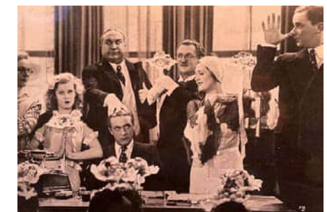
Szene aus »Die Drei von der Tankstelle« (1930)

12 Mittwoch, 6. Mai 2026, 19 Uhr: » Berlin als Filmstadt – vom Kurbelkasten der Brüder Skladanowsky bis zum modernen Multiplex «. Der Journalist und Autor Oliver Ohmann erzählt eine Erfolgsgeschichte mit Höhen und Tiefen. Das Medium Film ist sagenhaft eng mit unserer Stadt verbunden. Berlin war 1895 eine Wiege dieser modernen Kunstform, die man in den ersten Jahrzehnten noch als Rummelplatzvergnügen abtat. In der Weimarer Republik erfolgte der nie