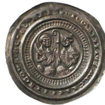
Abb. 10: Staatliche Museen zu Berlin, Münzkabinett, Objektnummer 18205013, Bode-Museum, Raum 242, Vitrine 51, Nr. 36, 0,83 g, 38 mm (Vergrößerung 1,5:1). 35 Die Umschrift lautet + VVICMANNVS ARCHIESCOVS SC-S MARI [ Wicmannus Archiepiscopus Sanctus Mauritius ] (= Erzbischof Wichmann, Heiliger Mauritius). Auf der linken Seite sieht man den Heiligen Mauritius mit Heiligenschein. In der Rechten hält er einen Palmzweig, die linke Hand ist erhoben. Auf der rechten Seite sitzt Wichmann mit Mitra. In der Rechten hält er den Krummstab (Bischofsstab), in der Linken ein Buch.

Im Vergleich zwischen dem geistlichen Münzherrn Wichmann auf der einen und den weltlichen Münzherren Albrecht und Jacza auf der anderen Seite fallen Gemeinsamkeiten, aber vor allem auch Unterschiede auf. Kriegerische Symbole der Stärke wie Schwerter lassen sich beim Magdeburger Erzbischof nicht finden – außer in einem Fall bei Mauritius, der aber auch als Anführer einer Legion das Martyrium gefunden haben soll.