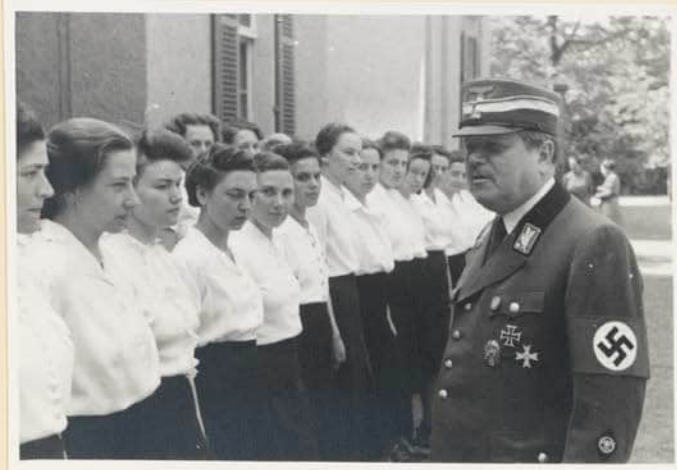
Reichspostminister Dr.-Ing. e. h. Ohnesorge schreitet die Front des angetretenen Lehrgangs ab