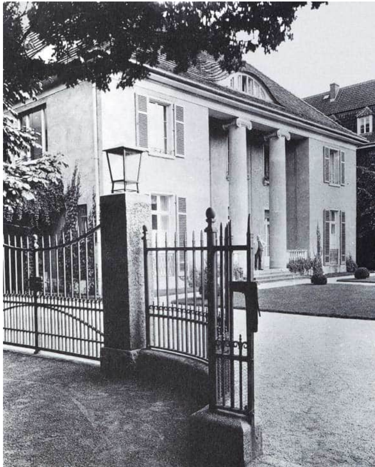
Sommerhaus der Familie Liebermann, Wannsee.

Es waren ereignisreiche Tage Anfang Juni im Kriegssommer 1941 am Wannsee. Der Frühsommer zeigte sich von seiner schönsten Seite, alles blühte, und das Zusammenspiel von Wasser und der in voller Blüte stehenden Landschaft lockte zum Aufenthalt in der Sommerfrische. Die Kriegssituation war von Erfolgen der Wehrmacht an allen Fronten geprägt, begleitet von der Erfolgspropaganda des Reichspropagandaministeriums. Die Vereinigten Staaten von Amerika verblieben noch, wenn auch zaudernd, in Neutralität.