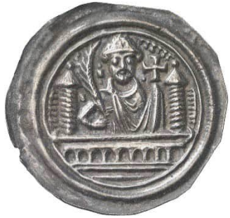
Abb. 1: Staatliche Museen zu Berlin, Münzkabinett, Objekt Nummer 18201081, Bode-Museum, Raum 242, Vitrine 52, Nr. 33, 0,79 g, 28 mm (Vergrößerung 1,5:1). 7 Der Brakteat, der dem Halberstädter Brakteatenmeister zugeschrieben wird, zeigt Albrecht frontal hinter einer Mauerbrüstung mit seitlichen Türmen. In der Rechten hält er einen Palmzweig und in der Linken ein Kreuz.

Halberstädter Brakteatenmeister wird von vielen, und dies völlig zu Recht, als einer der künstlerisch anspruchsvollsten Stempelschneider der Brakteatenzeit eingestuft. 6 Die Dauerausstellung des Berliner Münzkabinetts widmet ihm sogar eine eigene Vitrine.