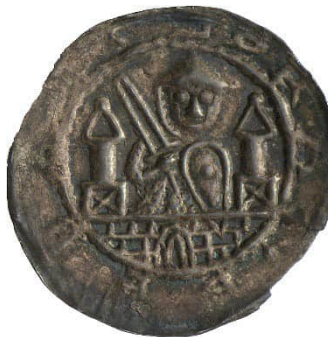
Abb. 3: Staatliche Museen zu Berlin, Münzkabinett, Objekt Nummer 18214701, Bode-Museum, nicht ausgestellt, 1,01 g, 30 mm (Vergrößerung 1,5:1). 9 Umschrift: + BRANDEBVRG (= Brandenburg). Der Brakteat zeigt den gerüsteten Albrecht frontal hinter einer Tormauer mit zwei Türmen. In der Rechten hält er ein Schwert und in der Linken einen Schild.

Nicht in der Dauerausstellung zu sehen sind Münzen Albrechts aus Brandenburg, das er erst 1157 endgültig in Besitz nehmen konnte. Beim Betrachten springt das deutlich geringere Geschick des Stempelschneiders von Abbildung 3 im Vergleich zum Halberstädter Meister gleich ins Auge.