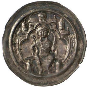
Abb. 8: Staatliche Museen zu Berlin, Münzkabinett, Objektnummer 18201095, Bode-Museum, Raum 242, Vitrine 51, Nr. 32, 0,98 g, 32 mm (Vergrößerung 1,5:1). 33 Die Umschrift lautet SC-S MA-VRIVSI [ Sanctus Mauritius ] (= Heiliger Mauritius). Der heilige Mauritius mit Heiligenschein thront unter einem Architekturbaldachin. In der Rechten hält er einen Kreuzstab und in der Linken einen Palmzweig.