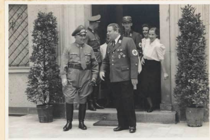
Reichsorganisationsleiter Dr. Ley und Reichspostminister Dr.-Ing. e.h. Ohnesorge verlassen das Heim am Wannsee