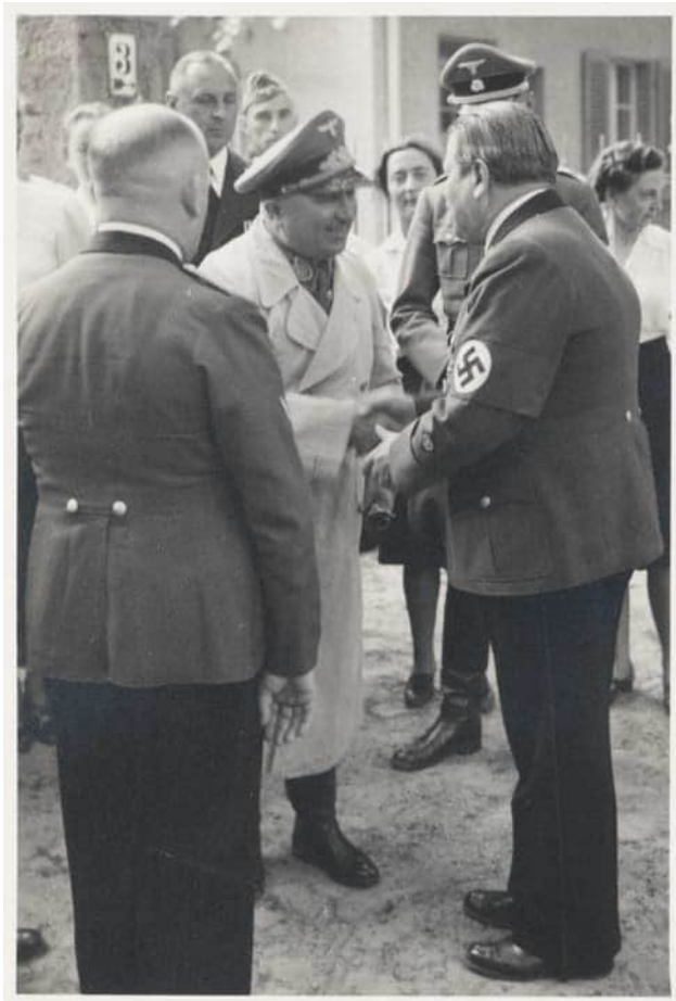
Originale Bildunterschrift: »Eröffnung des Lagers am 7. Juni 1941 Reichspostminister Dr.-Ing. e.h. Ohnesorge begrüßt Reichsorganisationsleiter Dr. Ley« (Mitte)

Reichspostminister Wilhelm Ohnesorge war bereits 1920 Parteimitglied geworden und ebenfalls glühender Anhänger der nationalsozialistischen Ideologie. Er war Günstling und Vertrauter Adolf Hitlers, Träger des Goldenen Parteiabzeichens und erhielt zahlreiche Anerkennungen und Dotationen des nationalsozialistischen Staates, so auch den »Totenkopfring der SS«. Er sorgte unter anderem mit dafür, dass Juden ab dem 18. Juli 1940 die »Rundfunkempfangsgenehmigung« entzogen wurde und sie im September 1940 vom Fernsprechverkehr gänzlich ausgeschlossen wurden. 14 Über die Einnahmen der Post »sponserte« er zahlreiche NS-Organisationen und auch Adolf Hitler persönlich. Martin Bormann und Leibfotograf Heinrich Hoffmann hatten die Idee, eine Sonderbriefmarke mit dem Konterfei Hitlers herauszugeben, um ihm Lizenzgebühren zuschanzen zu können, was Ohnesorge in die Tat umsetzte und Hitler mehr als 50 Millionen Reichsmark zukommen ließ, die dieser unter anderem zum Erwerb von Kunstwerken aus Beschlagnahmungen für sich nutzte. 15 Er wurde gerichtlich als einer der Hauptschuldigen der NS-Barbarei angesehen, hatte dann aber das Glück, dass die Schuldsprüche später aufgehoben wurden. Bis zu seinem Tod 1962 bezog er eine Pension – wie so viele ehemalige Nationalsozialisten im Deutschland der Nachkriegszeit. Die Fotos zeigen auch ihn im militärähnlichen Rock, die Mütze »geschmückt« mit dem prägnanten Hakenkreuz. 16