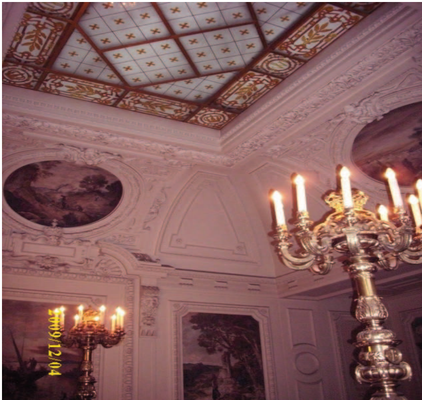
Aufgang zur Kaiserloge