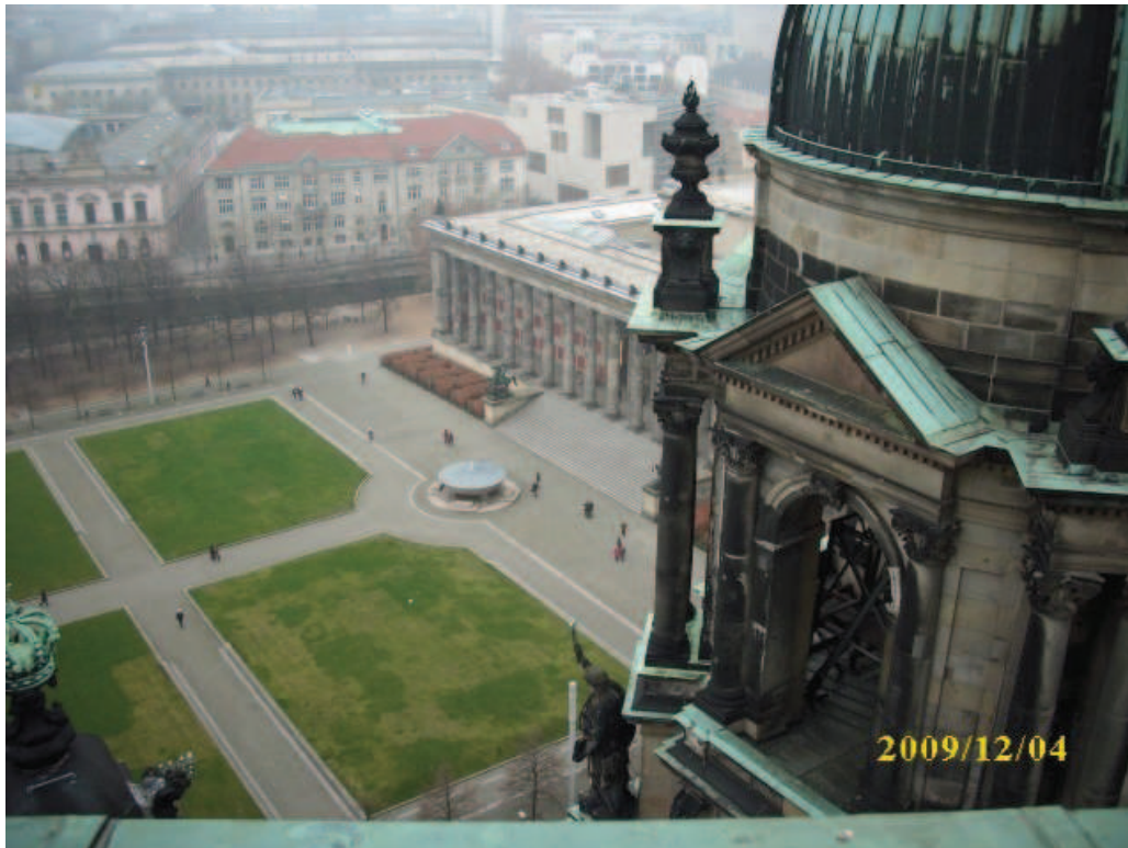
Blick vom Dom zum Lustgarten