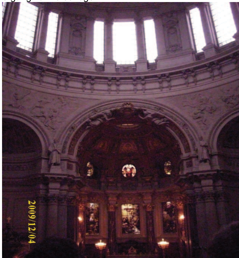
Blick in den Innenraum des Doms