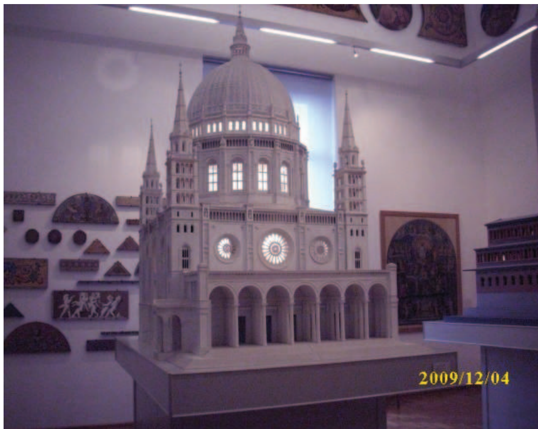
Modell des Berliner Doms im Dommuseum